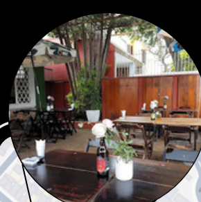
BAR E RESTAURANTE DO PARQUE

R. DONA GERMAINE BURCHARD, 264 - ÁGUA BRANCA, SÃO PAULO SP, 05002-060 (11) 3866-0000