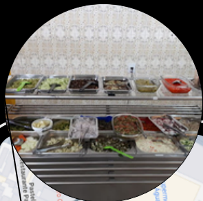
RESTAURANTE LÁ EM MINAS

AV. FRANCISCO MATARAZZO, 843 - ÁGUA BRANCA, SÃO PAULO - SP, 05001-000 (11) 2503-4374