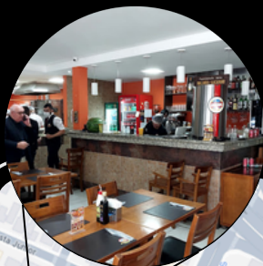
LIGUE ESFIHA KALIK PERDIZES

R. DONA GERMAINE BURCHARD, 186 - ÁGUA BRANCA, SÃO PAULO - SP, 05002-061 (11) 98177-3649