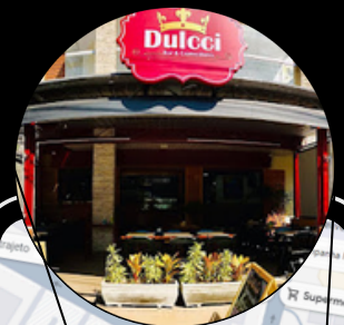
DULCCI BAR & COMEDORIA

R. DONA GERMAINE BURCHARD, 283 - PERDIZES, SÃO PAULO - SP, 05002-061 (11) 98698-0563